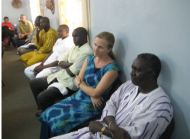
A view of the audience